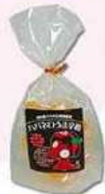
ハバネロうま辛飴