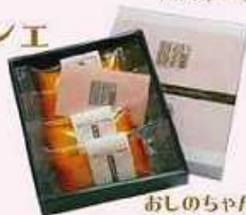
おしのちゃんフィナンシェ