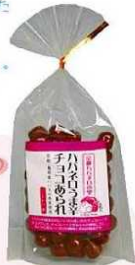
ハバネロうま辛チョコあられ

こだわりの京あられにハバネロを入れたチョコレートで仕上げました。チョコやあられの美味しさとあとから来るハバネロの風味と辛味が絶品です。辛いものが苦手な人でもまちがいなく美味しいと言って頂けます!