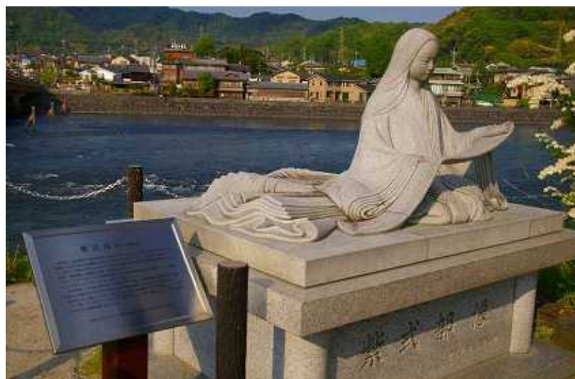
宇治大橋に設置された紫式部像