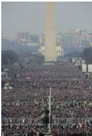
歴史的な瞬間を一目見ようと全米各地から大観衆が集まった

We should have high expectations but take care to ensure that they are not impossible expectations and allow him the time necessary to make a difference before condemning him. He cannot change the world simply by taking office; we have to give him a chance to fulfill his promises, while recognizing that we do not always know why certain decisions are made.